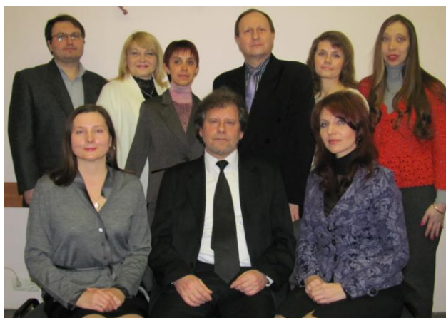
Колектив кафедри документознавства та інформаційної діяльності

Глибокий аналіз соціальних потреб, запит сучасного ринку праці щодо фахівців з певним обсягом і змістом знань, практичних вмінь і навичок, розвиток вищої освіти в умовах модерного розвитку інформаційного суспільства свідчать про потребу підготовки документознавців.