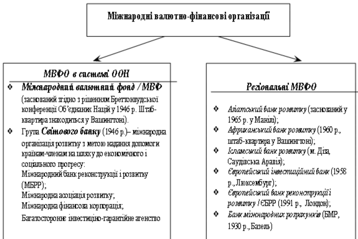
Рис. 10.1. Міжнародні валютно-фінансові організації

За сферою функціонування розрізняють МВФО у системі ООН та регіональні МВФО (рис. 10.1).