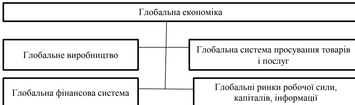
Рис. 4.2. Функціональні блоки глобальної економіки

Отже, глобальна економіка - якісно новий етап розвитку світової економіки, яка поступово перетворюється на цілісний єдиний глобальний організм, утворений гігантською виробничо-збутовою, глобальною фінансовою та планетарною інформаційною мережею.