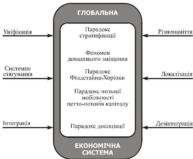
Рис. 7.1. Графічна інтерпретація парадоксів глобалізації.

постіндустріальних країн. Активізації набув і процес абсорбції інтелектуального потенціалу з країн периферії.