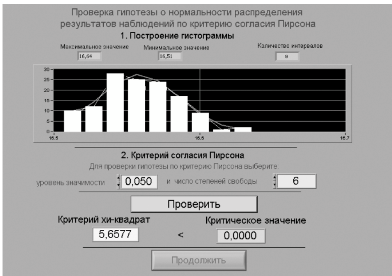
Рисунок 3.4 Вид рабочего стола при проверке гипотезы о нормальном распределении по критерию согласия Пирсона