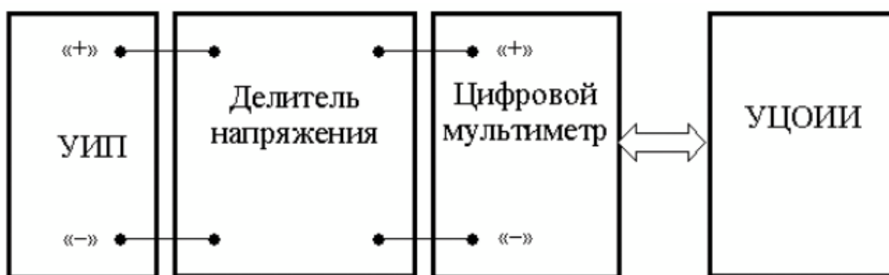
Рисунок 3.2 Схема соединения приборов при выполнении работы

В процессе выполнения работы измеряется постоянное напряжение, значение которого лежит в диапазоне от 2 до 30 мВ. В этом случае для проведения измерений может подойти или цифровой вольтметр или компенсатор (потенциометр). Однако выполнять серию из нескольких десятков наблюдений с помощью компенсатора крайне неудобно. Поэтому в работе используется цифровой измеритель постоянного напряжения, а для уменьшения трудоемкости измерений выбран такой режим его работы, когда по стандартному интерфейсу осуществляется автоматическая передача результатов наблюдений от модели цифрового мультиметра к модели цифрового устройства обработки измерительной информации (рисунок 3.2).