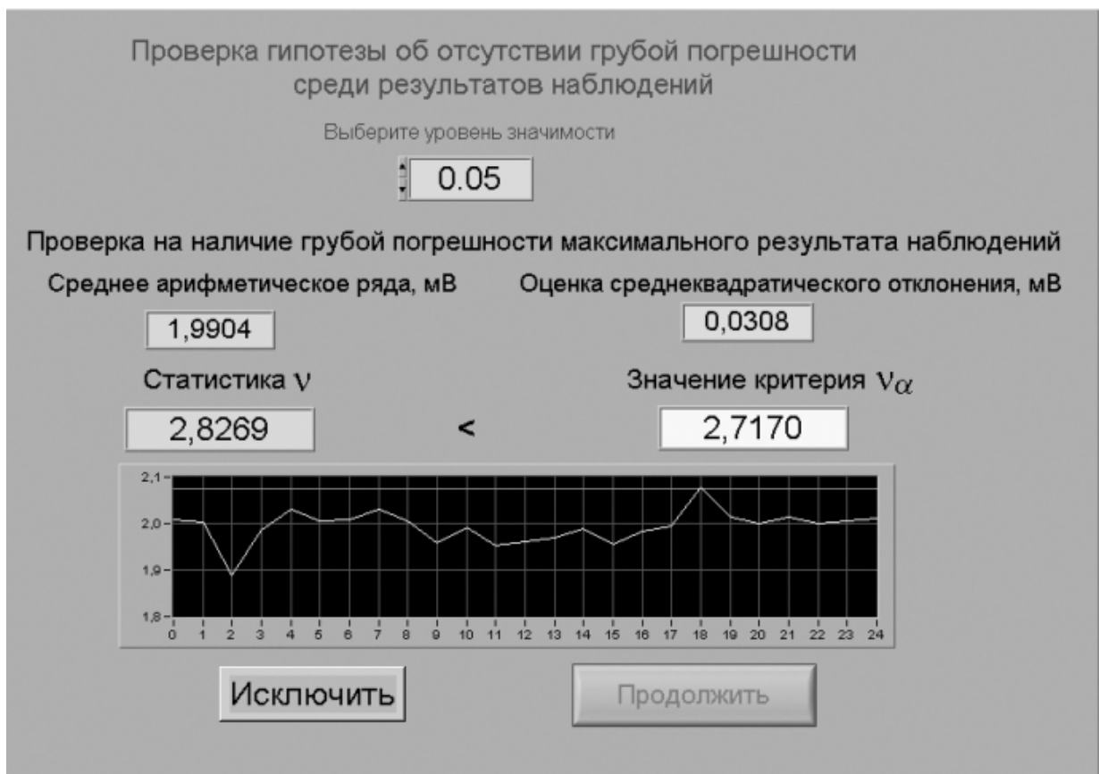
Рисунок 5.3 Вид рабочего стола при проверке гипотезы об отсутствии грубой погрешности среди результатов наблюдений